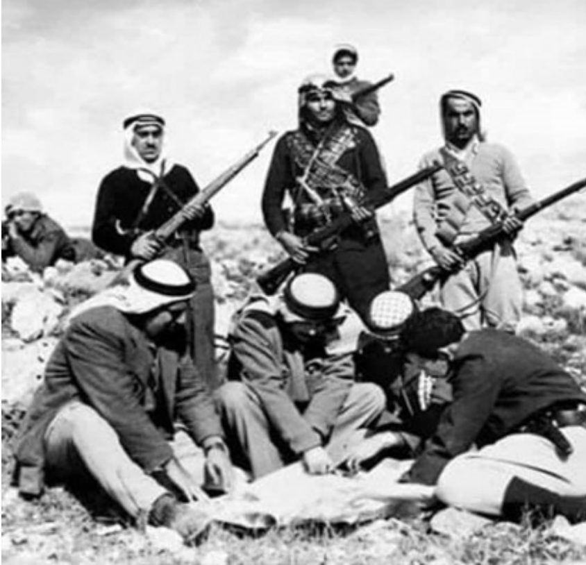
مجاهدو ثورة ١٩٣٦/١٩٣٩

إلى طريق التعاون مع بريطانيا، حيث أعلن باسم الثوار رفضه للكتاب الأبيض مما شكل ضغطاً على أعضاء اللجنة العربية العليا وتحديداً، جمال الحسيني، أحمد حلمي، عوني عبد الهادي وحسين الخالدي وغيرهم ليرضخوا لرأي الحاج أمين والمجاهدين ولتصدر بياناً في ٣٠ أيار/ مايو ١٩٣٩ أعلنت فيه رفض الكتاب الأبيض وختمته بهذه العبارة «إن الأمم الحية لا يكون القول الفصل في حياتها ومستقبلها والقرار الأخير في مصير أوطانها وذراريها للكتب البيض أو السود، إنما القول الفصل والقرار لإرادة الأمة نفسها، وقد أعلنت الأمة العربية إرادتها وقالت كلمتها داوية وجازمة، وستصل إلى ما تريد بعون الله، ستستقل فلسطين ضمن الوحدة العربية، وستبقى عربية إلى الأبد.» (١)